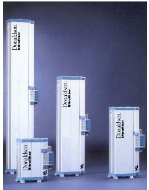
Oilfreepac® 2000 Standard

Das entspricht einem Restwasser-gehalt von 0,11 \text{ g/m}^3 . In der folgenden Aktivkohleaufbereitungsstufe (9) werden Öldämpfe, Kohlenwasserstoffe, Geruchs- und Geschmacksstoffe bis zu einem Restgehalt von unter 0,003 \text{ mg/m}^3 zurückgehalten. Im nachgeschalteten Staubfilter (3) wird eventuell anfallender Abrieb der Adsorbentien aus der Druckluft entfernt. Während sich ein Adsorber mit Trockenmittelkartuschen im Trocknungsstakt (Adsorptionsphase) befindet, wird das Trockenmittel im anderen Adsorber wieder getrocknet (Regenerationsphase). Ein Teilstrom bereits getrockneter Luft wird über eine Düse (6) auf atmosphärischen Druck entspannt, zur Regeneration über das Trockenmittel geführt und über ein Magnetventil und einen Schalldämpfer an die Umgebung abgeführt.