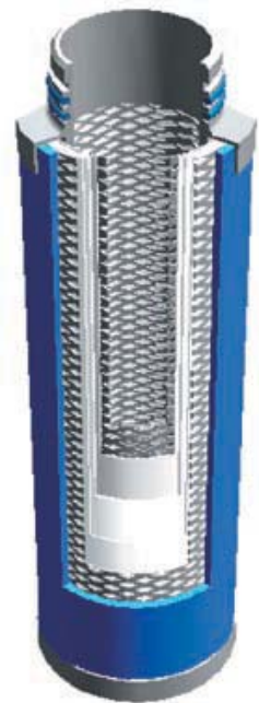
Querschnitt durch den Ultrair Tiefenfilter

Unter Ausnutzung verschiedener Filtrationsmechanismen wie Abscheidung durch Aufprall, Siebeffekt und Diffusion werden Flüssig- und Festkörperschwebstoffe bis zu 0,01 µm Grösse im Filter zurückgehalten.