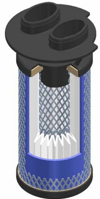
Querschnitt durch den Ultrair Tiefenfilter