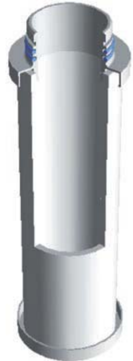
Querschnitt durch den Ultrapoly

Unter Ausnutzung verschiedener Filtrationsmechanismen – wie Abscheidung durch Aufprall und Siebeffekt – werden die Verunreinigungen bis zu 25 µm im Filter zurückgehalten.