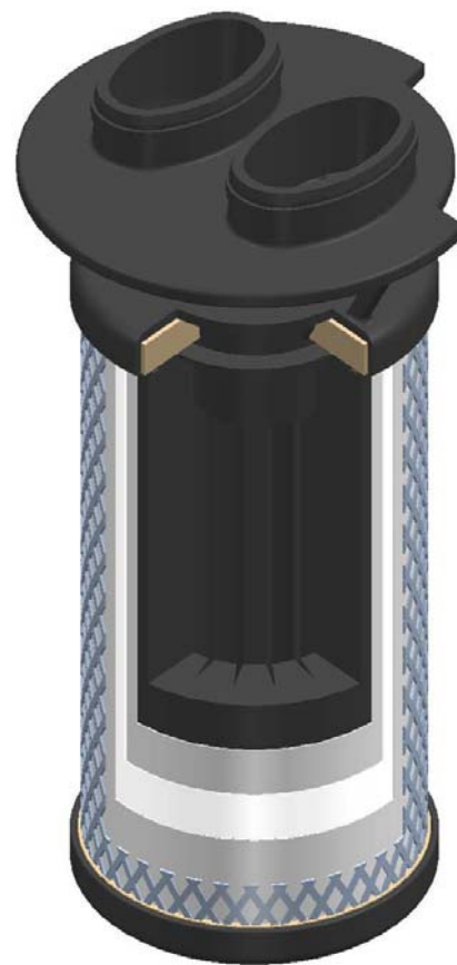
Vue en coupe de l'élément filtrant Ultrac

Un insert spécial assure une distribution du flux optimisée. La direction du flux à travers le filtre est de l'intérieur vers l'extérieur. Ainsi la perte de charge est minimale et permet d'utiliser au maximum le média filtrant. Avec une purification amont appropriée (voir „pré-purification recommandée“), une teneur résiduelle en huile inférieure de 0,01 mg/ m 3 jusqu'à < 0,003 mg/ m 3 est obtenue.