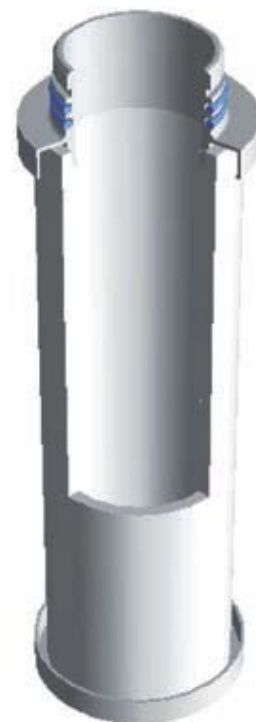
Vue en coupe du préfiltre Ultrapoly

Par l'utilisation de divers mécanismes de filtration, tels que l'impact direct ou l'effet d'attraction moléculaire, les contaminants jusqu'à une taille de 25 µm sont retenus par le filtre.